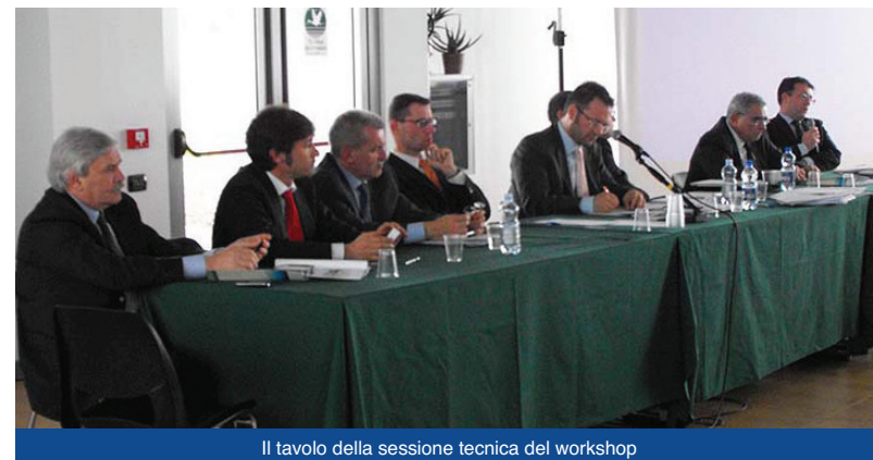
Il tavolo della sessione tecnica del workshop

L'obiettivo degli organizzatori del progetto Transitecs "è di utilizzare questo primo shuttle per dimostrare la fattibilità e la convenienza di un sistema più ampio di collegamenti gateway fra i porti liguri e la Germania, in particolare le aree del Sud-Ovest come il Baden-Wurtemberg i cui